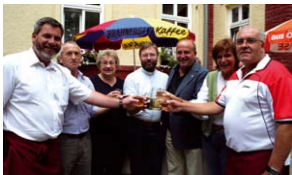
„Prost“ auf einen gelungenen Pfarrheurigen.

Der bereits traditionelle Blumauer Pfarrheurige erfreute sich auch in diesem Jahr über große Beliebtheit bei den Gästen. Kein Wunder, wurde doch nicht nur mit G´spritzen und einer Tombola für Stimmung gesorgt, echtes Großheurigenflair vermittelte die Blumauer Blasmusik.