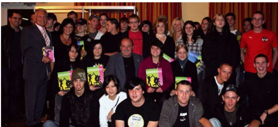
Die 16-19-jährigen wurden bei der 1. Jungbürgerfeier der Gemeinde herzlich willkommen geheißen.