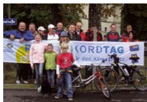
Der Rad-Rekordtag in Blumau-Neurisshof fand großen Anklang.