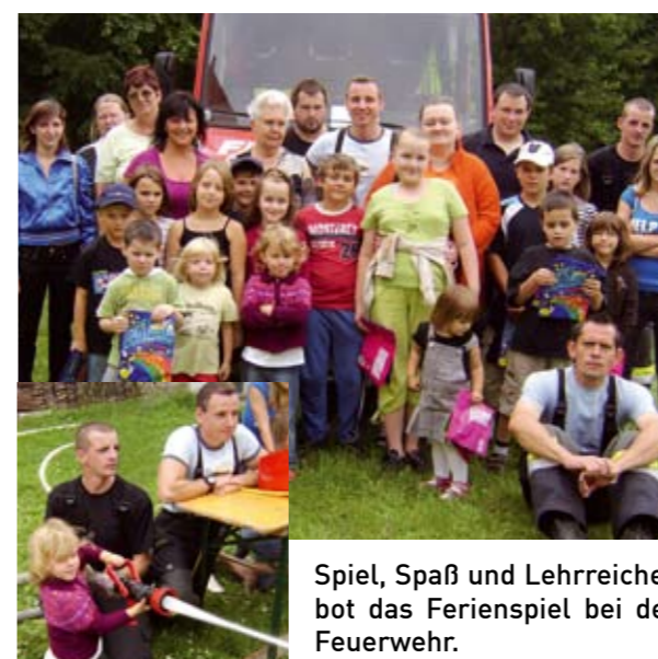
Spiel, Spaß und Lehrreiches bot das Ferienspiel bei der Feuerwehr.

Im Sommer hatten die Kinder unserer Ortschaft die Möglichkeit, die Feuerwehr einmal „hautnah“ zu erleben. Unter dem Motto „Tag der Feuerwehr“ konnte man in unterschiedlichen Stationen unsere Wehr kennen lernen. Die erste Station befasste sich mit