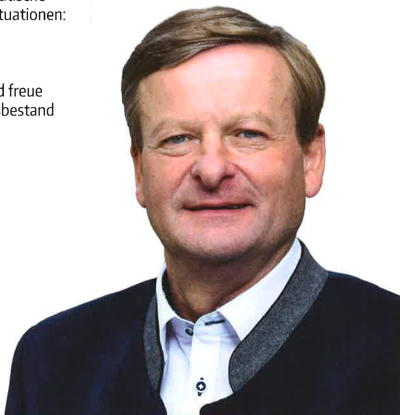
Gottfried Waldhäusl Tierschutzlandesrat