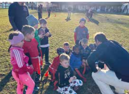
Die Mustangs laden zu Flag Football

Verein „Mustangs“ lädt zum Mitmachen ein