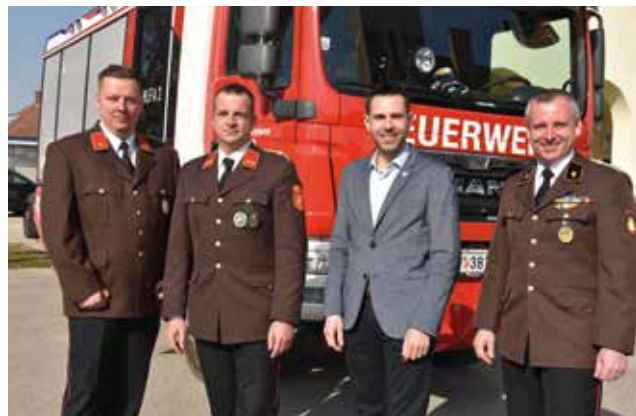
Bürgermeister René Klimes gratuliert dem Kommando zum Ausbildungserfolg