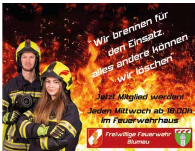
Werden auch Sie Teil der Mannschaft