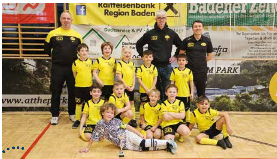
Unsere U8 beim Bezirkshallenturnier in Baden