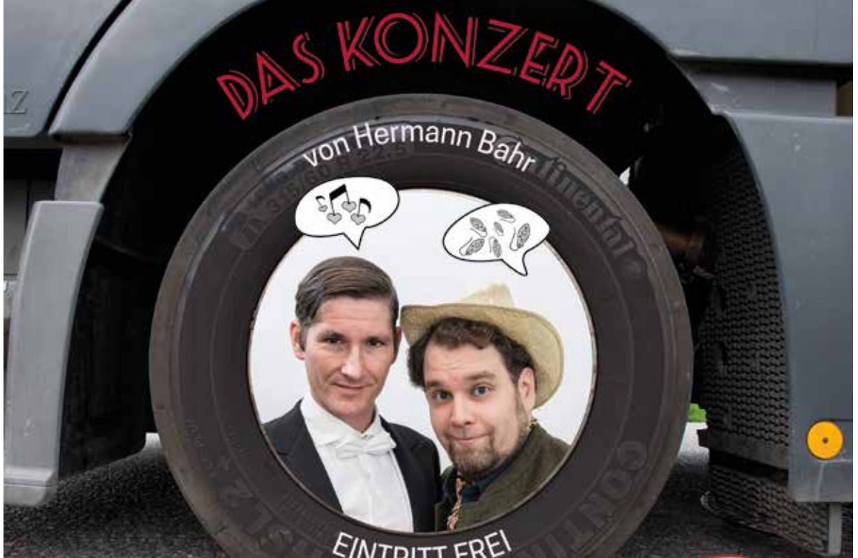
Am 3. Mai gibt das Lastkrafttheater „Das Konzert“ zum Besten, der Eintritt ist frei.