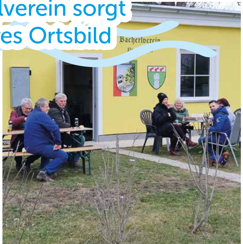
Mit vereinten Kräften wurden die Hauptallee und weitere beliebte Spazierwege gepflegt.

D as Arbeitsjahr des Bacherlvereins hat früh begonnen. Denn am 3. Jänner ist im Steinböckpark bei Sturm großer Windwurfschaden entstanden. Unter anderem musste ein umgestürzter Baum mittels Traktor und Kran beseitigt werden.