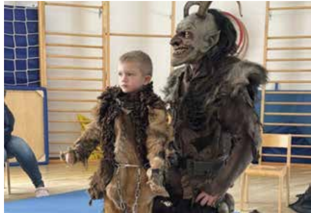
Die Pulverteufeln begeisterten mit ihrem Besuch.