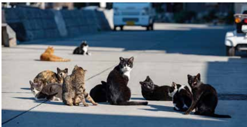
Freigänger müssen kastriert werden, um ungewollte Vermehrung zu vermeiden.

Das Einfangen von Streuerkatzen und die weitere Vorgehensweise ist mit der Gemeinde bzw. mit einer Tierärztin oder einem Tierarzt abzustimmen. Den Gemeinden wird empfohlen, vor dem Einfangen von Streuertieren die Bevölkerung entsprechend zu