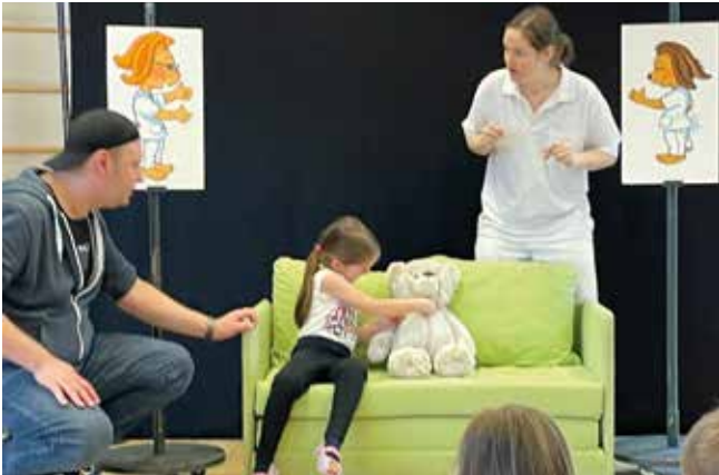
Pflegeberufe beim Mitmachtheater