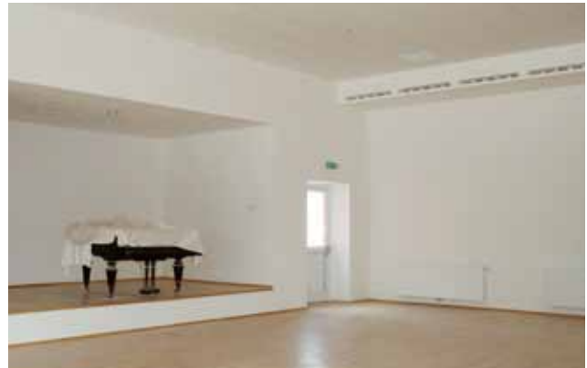
Rundum gelungen präsentiert sich unser Kollersaal.

Es ist fast geschafft! Die Bauarbeiten neigen sich ihrem Ende zu und es ist wahrlich ein wunderschöner Veranstaltungssaal entstanden, der allen gesetzlichen Bestimmungen ent-