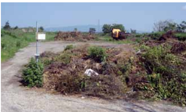
Unmengen von Unrat wurden illegal am bzw. vor unserem Grünschnittplatz entsorgt.

Fakt ist, auf dem derzeit genutzten Areal entstanden Bauplätze, die seit geraumer Zeit zum Verkauf angeboten wer-