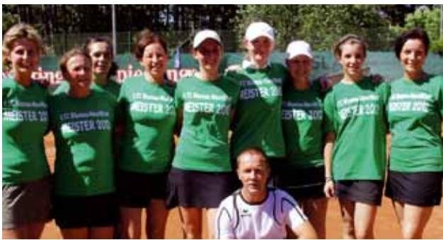
Die siegreiche Damenmannschaft des 1. TC.

Ein sensationelles Frühjahr mit sommerlichen Temperaturen bescherte dem 1. TC-Blumau am 15. April einen ganz besonderen Start in eine ganz besondere Spielsaison 2012 und gleichzeitig den Auftakt in ein zweifellos gedenkwürdiges Vereinsjahr. Eine besondere Spielsaison, weil es bereits jetzt, im Zuge der N.Ö.-Kreis-Süd Meisterschaften einiges zu feiern gibt. So hat es einerseits die Damenmannschaft geschafft, sich zum ersten Mal in der Vereinsgeschichte den Meistertitel zu holen und andererseits konnte sich die Herrenmannschaft als Vizemeister etablieren. Das war aber noch lange nicht alles. Das Gedenkwürdige an diesem Jahr beruht nämlich auf der Tatsache, dass der 1. TC-Blumau-Neurißhof seine Teeniejahre hinter sich lässt. Er feiert sein zwanzigjähriges Bestehen. Zwanzig Jahre in denen zahllose begeisterte Vereinsmitglieder spielerisch ihre Gesundheit stärkten, unzählige gemütliche Abende gemeinsam zelebriert wurden und engagierte Ta-