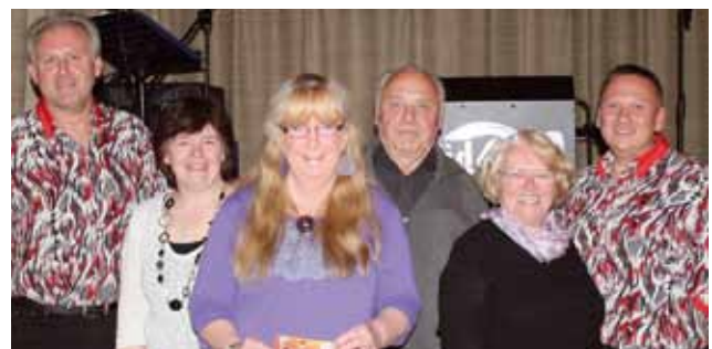
„Südband“ heizte beim Austropop-Event gehörig ein.

Am 20. Juli 2012 findet im Rahmen des Ferienspieles ein Rad- und Badetag statt, den der Siedlerverein gemeinsam mit den Kinderfreunden veranstaltet. Es wird gegrillt, gespielt, geradelt und bei Schönwetter gebadet. Bitte geben Sie den Kindern Badebekleidung mit. Über die weiteren geplanten Aktivitäten werden wir Sie informieren. Wir freuen uns jetzt schon auf ein Wiedersehen im Kinderfreunde-