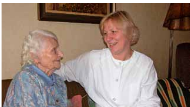
Betreutes Wohnen gibt Sicherheit!

Schritten vorangetrieben. Über Details werden wir Sie in der nächsten Gemeindezeitung informieren. Ich möchte Sie, liebe Bevölkerung, aber schon jetzt zur im Juni stattfindenden Spatenstichfeier einladen. Eine offizielle Einladung ergeht zeitgerecht an alle Haushalte.